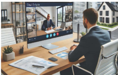
すでに実現しているオンラインでの商談

さらに、少子社会で人手不足が常態化するなか、不動産業務にDX(デジタルトランスフォーメーション)を導入することで、物件の内見対応や契約手続きといった従来のアナログ作業が削減でき、それによってコアな業務に集中できることから業務効率の向上が期待されます。それが時間と心の余裕を生み、ライフワークバランスの改善、ひいては従業員のモチベーションアップに寄与すると考えています。