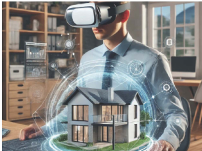
臨場感のあるVRを活用した不動産内覧