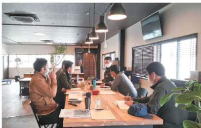
カフェ風スペースでの打合せ風景