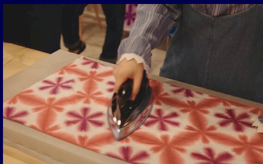
雪花絞り染め体験 (40分)