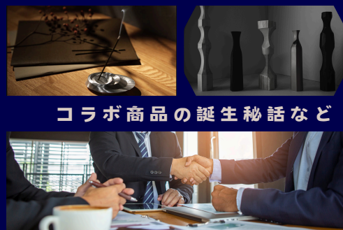
コラボ商品の誕生秘話など